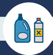
TISZTÍTÓSZEREK ÉS EGYÉB MÉRGEZŐ VEGYSZEREK