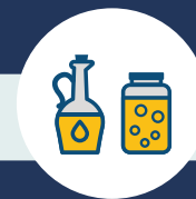
HASZNÁLT OLAJ ÉS ZSÍR