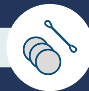
KOZMETIKAI CIKKEK (VATTAPAMACS, FÜLTISZTÍTÓ, STB.)