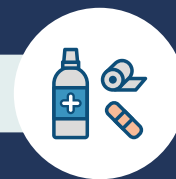
GYÓGYSZEREK ÉS KÖTSZEREK