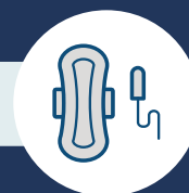
EGÉSZSÉGÜGYI BETÉT, TAMPON