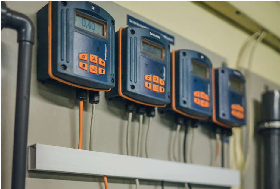
2. ábra: Vízminőségi jellemzők mérőműszerei

A vízkitermelés környezetében a szennyezés megelőzésének egyik fontos feladata a védőterületek, védőidomok kijelölése.